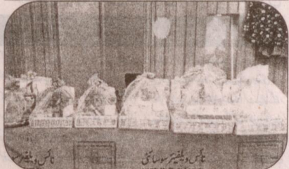
انس ویلفیئر سوسائٹی