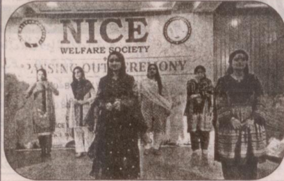
طالبات وکم وکم وکم پیش کرتے ہوئے