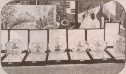
تقریب میں شریک بچوں کیلئے انعامات رکھے گئے ہیں