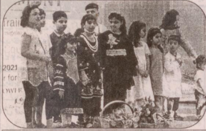
تقریب میں شریک بنے