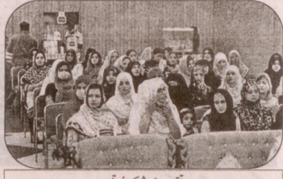
تقریب میں شریک خواتین