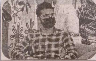
مسٹر ضوان اعجازیٹر رہنما پاکستان تحریک انصاف

انس ویلفیئر سوسائٹی کے زیر انتظام ووکیشنل ٹریننگ پروگرام کی پانگ آؤٹ تقریب