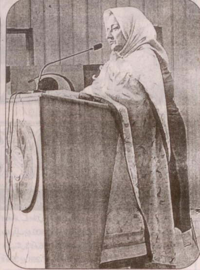
سرگامی تقریب سے خطاب کر رہی ہیں